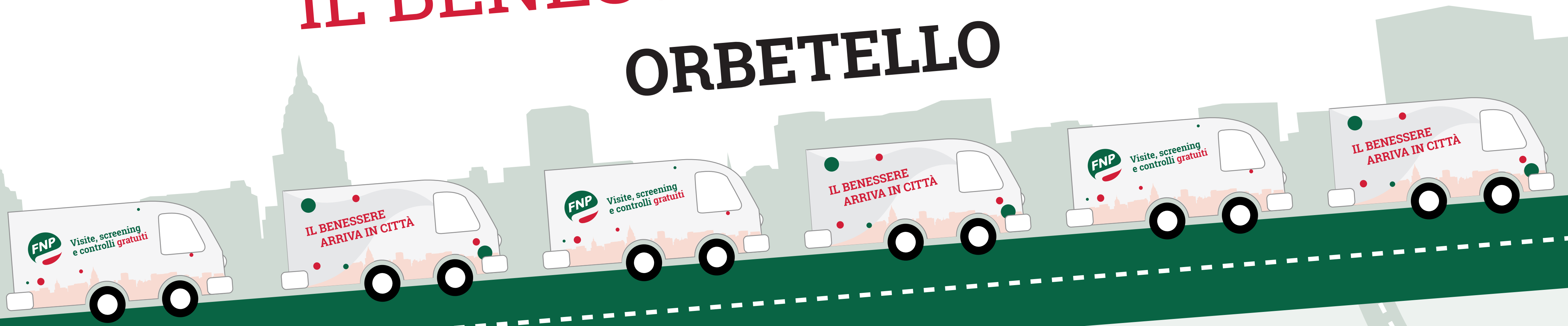
Tavola Rotonda Prevenzione è Benessere